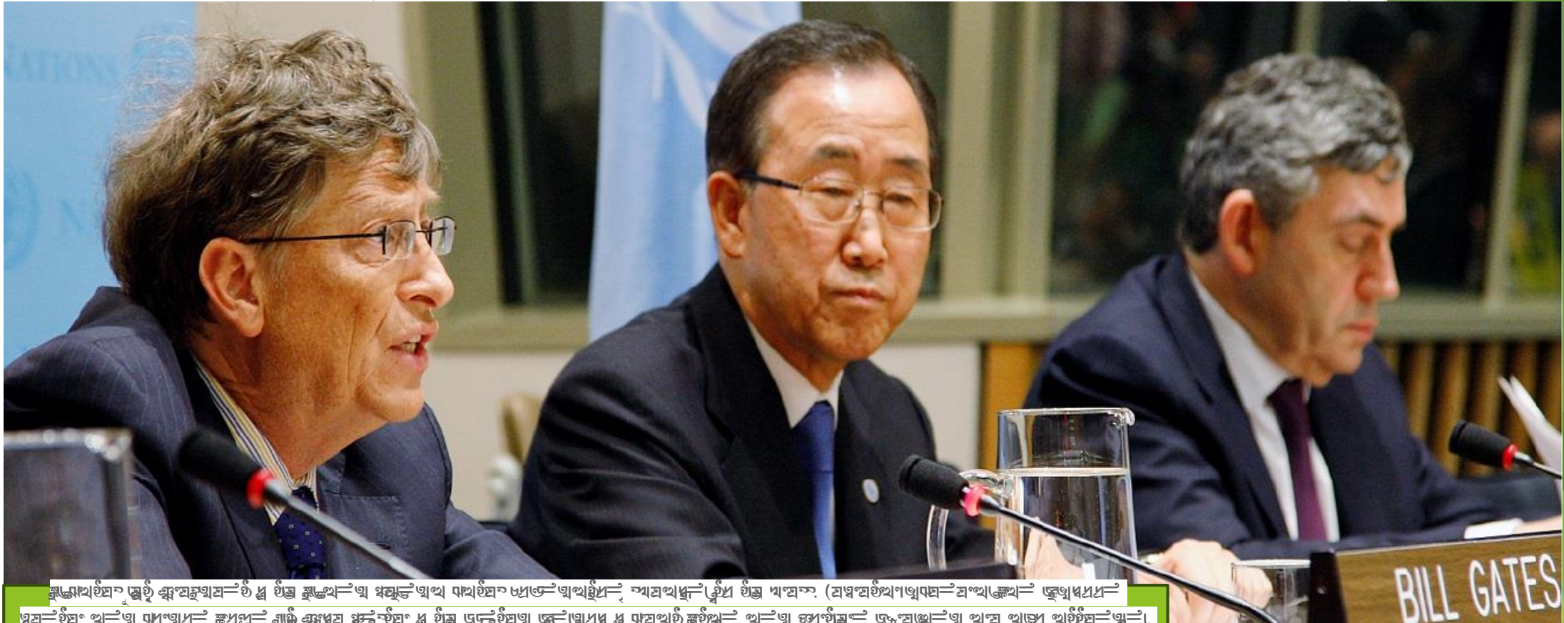
ප්‍රාග්ධන සම්පත් සංරක්ෂණයේ ඉහළ මට්ටමකට පත්වීමේ අරමුණ පැහැදිලි කිරීමේ දිනය 22 ඔක්තෝබර් 2008, නියු ජර්සි. (ප්‍රාග්ධන සම්පත් සංරක්ෂණයේ ඉහළ මට්ටමකට පත්වීමේ අරමුණ පැහැදිලි කිරීමේ දිනය 22 ඔක්තෝබර් 2008, නියු ජර්සි. (ප්‍රාග්ධන සම්පත් සංරක්ෂණයේ ඉහළ මට්ටමකට පත්වීමේ අරමුණ පැහැදිලි කිරීමේ දිනය 22 ඔක්තෝබර් 2008, නියු ජර්සි.)

නියු ජර්සි, 22 ඔක්තෝබර් 2008. (ප්‍රාග්ධන සම්පත් සංරක්ෂණයේ ඉහළ මට්ටමකට පත්වීමේ අරමුණ පැහැදිලි කිරීමේ දිනය 22 ඔක්තෝබර් 2008, නියු ජර්සි.)